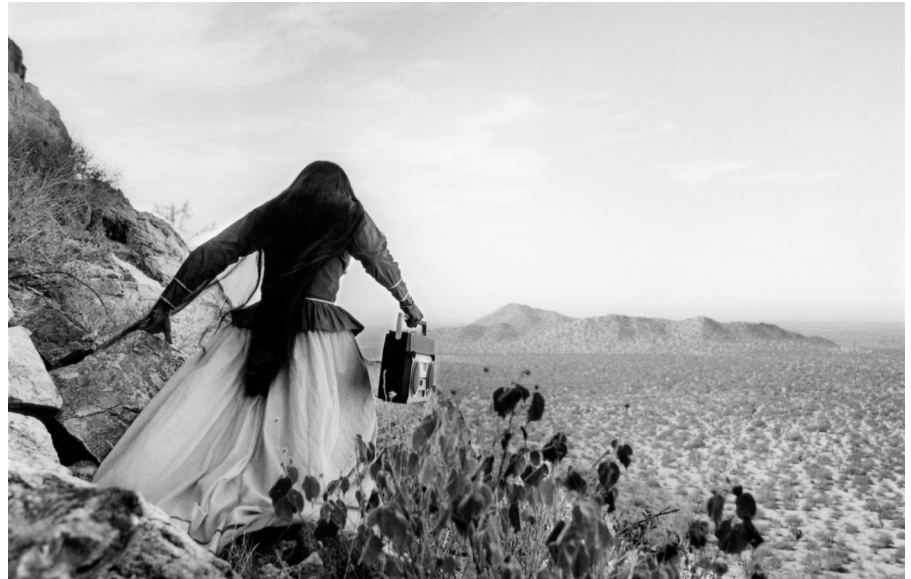
Mujer Ángel, Sonora-Wüste, 1979