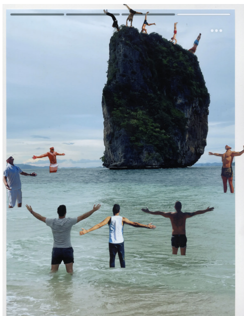
A MILF DREAM - my matches on tinder, 2024 © Jenny Rova

Wie locken oder betören uns Bilder, die online zirkulieren? Wie fesseln, steuern oder täuschen sie uns? Die 14 künstlerischen Positionen in der Ausstellung setzen sich mit visuellen Phänomenen auseinander, die online als Vehikel für Kommunikation, Kritik oder Komik dienen. Sie veranschaulichen, welche zentrale Rolle Bilder in der Gestaltung unserer sozialen, kulturellen und politischen Umgebung spielen. Die Ausstellung lädt dazu ein, die visuellen Welten von Social-Media-Feeds, Dating-App-Profilen, Beauty-Filtern, Memes, ASMR-Videos, cute (niedlichen) oder cursed (verfluchten) images, Emojis, computergenerierten Bildern oder pixeligen Screenshots zu erkunden, die als Verschwörungstheorien oder als Protestmittel gleichermaßen zum Einsatz kommen können. Dabei legen die künstlerischen Arbeiten die komplexen Mechanismen der Verführung im digitalen Raum offen und beleuchten, wie Bilder und die ihnen zugrunde liegenden Strukturen – von Algorithmen bis zu Datensätzen – unsere Aufmerksamkeit lenken, Gefühle provozieren und Meinungen beeinflussen.