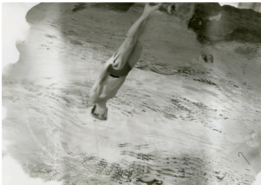
Grosser Flieger , 1983

In Dörte Eißfeldts (*1950) Bildern ist nichts so, wie es scheint – und nichts bleibt, wie es ist. Anstatt Wirklichkeit einfach nur abzubilden, wird Fotografie in ihrem Werk zu einem Medium der Verwandlung. Mit einem zarten, poetischen und stets neugierigen Blick erkundet Eißfeldt die Welt um uns herum, den menschlichen Körper und das Medium selbst. Ein Schneeball schmilzt auf einem Bild, auf einem anderen wirkt er felsartig und wie ein Himmelskörper. Eine Messerklinge erscheint wie ein Megalith, Oberflächen verändern ihre Beschaffenheit, Haut wird metallisch, dann wieder zerbrechlich und porös. Immer wieder lotet Eißfeldt aus, wie Fotografie sich selbst befragt, sich verwandelt und die Grenzen der Wahrnehmung verschiebt. Der Titel der Ausstellung bezieht sich auf ein Zitat von Eißfeldt, in dem sie schreibt: „Fotos sind wie Wale, die ganze Inseln tragen können.“ Die Ausstellung gibt diesem Archipel von Inseln Raum – getragen von den Foto-Walen: Inseln der Bedeutung, der Erinnerung, der Ähnlichkeit oder des Eindrucks eines Moments. Über fünf Jahrzehnte hinweg, mit Schlüsselwerken aus ihrem persönlichen Archiv, großformatigen Serien sowie bislang unveröffentlichten und nie gezeigten Skizzen, Kunst- und Notizbüchern, präsentiert C/O Berlin eine lang erwartete, umfassende institutionelle Ausstellung ihres Schaffens. Kuratiert von Boaz Levin.