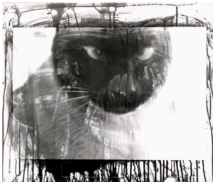
Katze, 1980 © Walter Schels / Stiftung F. C. Gundlach

Anlässlich des 90. Geburtstags von Walter Schels (*1936) zeigt C/O Berlin in Zusammenarbeit mit der Stiftung F. C. Gundlach die erste große Retrospektive des Fotografen, die auf einer umfassenden Sichtung seines gesamten Printwerks mit über 10.000 Originalabzügen basiert. Seit mehr als sechs Jahrzehnten widmet sich Schels den Grundthemen menschlicher Existenz. Seine Bilder erforschen Normen, Tabus und Grenzerfahrungen. Stets stellen sie Fragen nach Individuum, Identität und Transformation. Schels hat eine unverwechselbare Bildsprache zwischen dokumentarischer und künstlerischer Fotografie entwickelt. Diese erweitert er durch eine Vielzahl von Materialitäten. Mithilfe serieller Konzepte und unterschiedlicher experimenteller Ansätze macht er sowohl formale Strukturen als auch Prozesse sichtbar. Die Ausstellung beleuchtet mit rund 250 Werken zentrale Themen seines Œuvres in ihrer Komplexität. Zu sehen sind prägende Werkgruppen – darunter Porträts bekannter und unbekannter Persönlichkeiten, Serien über Jugendliche in Transition oder Sterbende, sowie Tieraufnahmen oder Pflanzenbilder, die durch chemische Übermalungen entstanden sind. Ergänzt werden diese durch frühe Arbeiten aus dem Archiv und biografische Materialien, die Einblicke in die Arbeitsweise dieses außergewöhnlichen Fotografen geben. Kuratiert von Sophia Greiff, Beate Lakotta, Sebastian Lux und Franziska Mecklenburg.