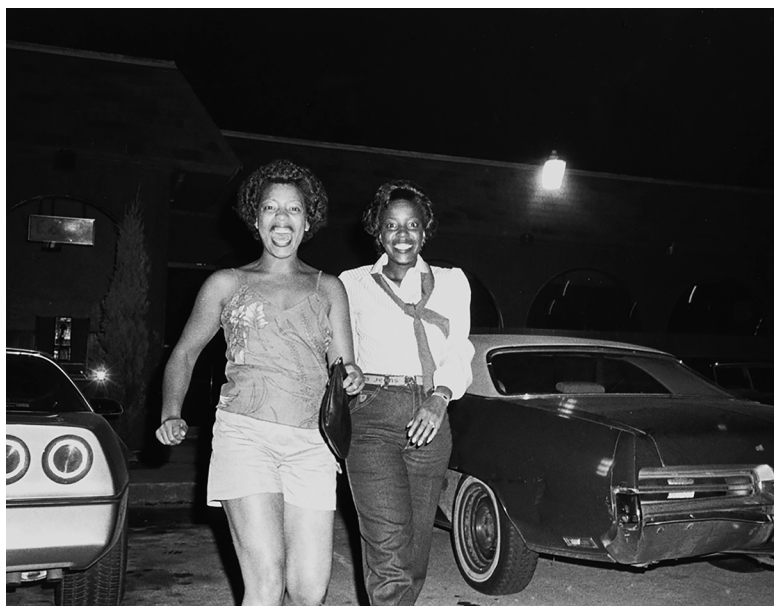
Welcome Home , 1978–84 © Carrie Mae Weems. Courtesy the artist and Gladstone Gallery, New York, Fraenkel Gallery, San Francisco, and Galerie Barbara Thumm, Berlin