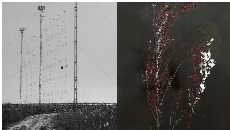
Butterflies (Haarp) , 2020 © Stelios Kallinikou / Lupin, Fougère, Genêt , Silbergelatineabzug, Siebdruck, 2024 © Susanne Kriemann, VG Bild-Kunst, Bonn, 2025